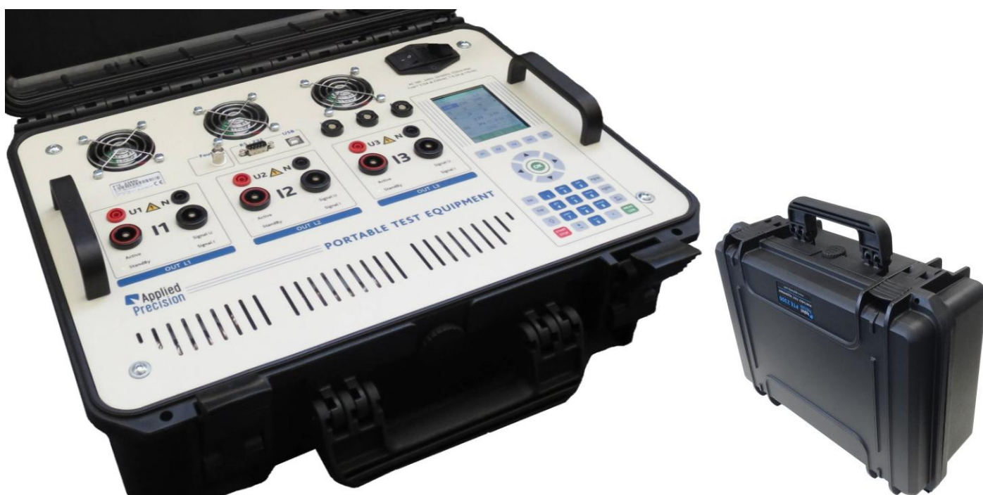
Portable Test Equipment

Il PTE "Portable Test Equipment" consiste in un generatore trifase di tensione e corrente integrato con un contatore campione elettronico trifase con classe di precisione da 0.05% o 0.02%.